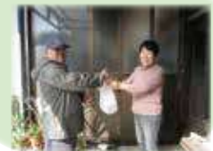
▲地区独自の訪問活動