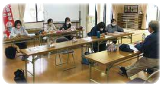
▲ふれあいサロンの様子