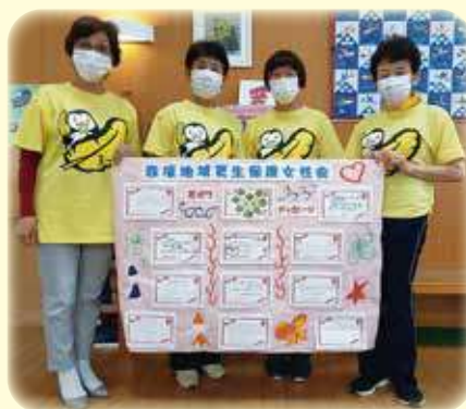
エコキャップ回収総数