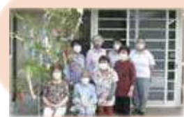
▲毎月のいきいきサロン