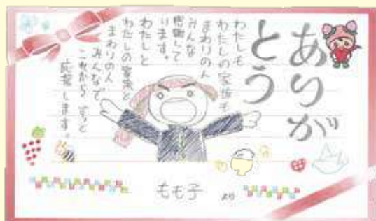
メッセージカード

たくさんのペットボトルキャップや、心温まるメッセージ、「After コロナの未来・希望」をテーマとした素敵な作品を届けていただきました。頂いたメッセージカード等は、市内福祉施設等へお届けします。一部作品をご紹介します。