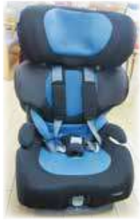
▲チャイルドシート