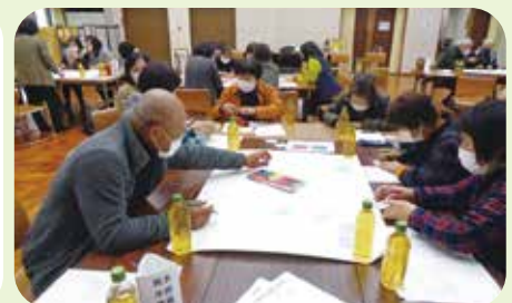
▲情報交換会の様子

会の最後にそれぞれの委員・団体から報告を行ない、全体で共有しました。この情報交換会を受けて、地区社協の今後の活動を検討していく予定です。