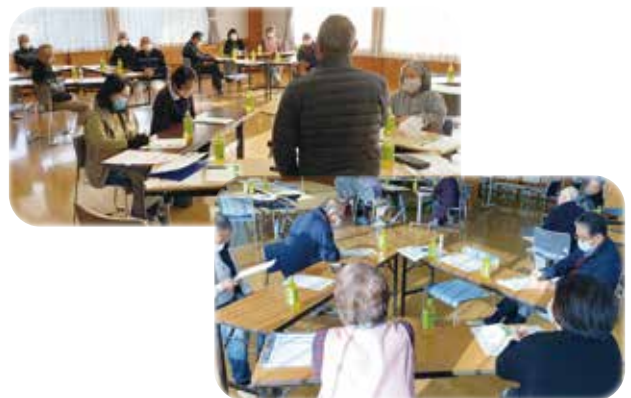
▲福祉座談会の様子

今後は両宮地域ぐるみ活動協議会のなかの福祉部（仮）として、地区社協機能を包括できるか、役員会で検討が進められる予定です。