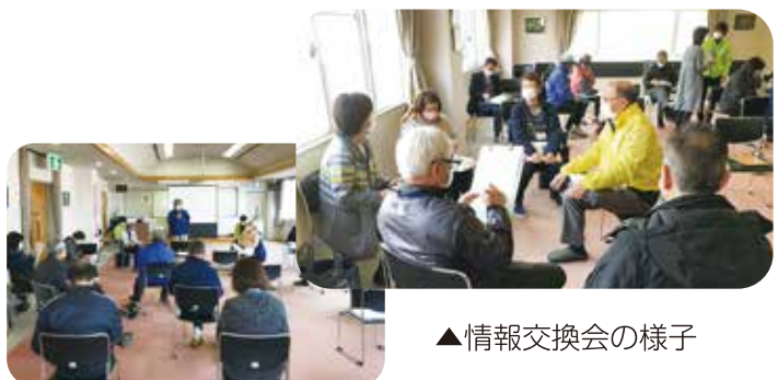
▲情報交換会の様子

各町内がアイデアを出しながら、活動の継続・再開に向けて取り組まれており、「ほかの町内の活動を自分たちの活動の参考にしたい」等の感想をいただきました。