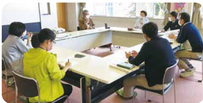
▲グループワークの様子

また、法人連絡会としてコロナ禍でも実施が可能な地域公益活動の取り組みについて、ふれあい地域交流、子どもの居場所、福祉教育を中心に話し合いが行われました。