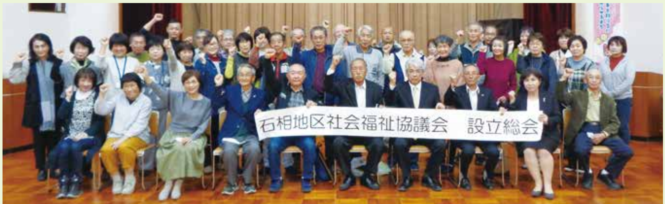
(写真撮影時のみマスクを外しています。)

令和3年11月3日（水）に設立総会が行われ、市内10番目となる石相地区社協が誕生しました。赤坂地域では、全ての地区で地区社協が立ち上がりました。