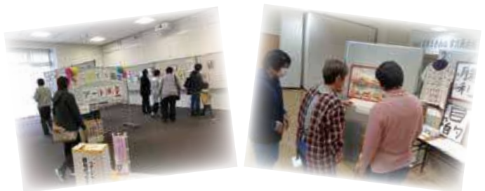
▲前回の作品展の様子