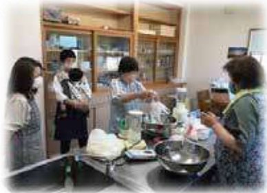
▲ゴキブリ団子づくりの様子

各種委員の“ふれあい”と地区住民への“見守り”がひとつに繋がった活動となっています。