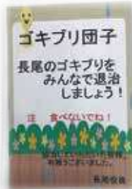
▲注意喚起のチラシ