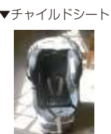
▼チャイルドシート