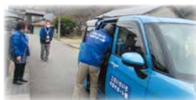
▲付添いで安心して外出中

◎今後も、通所付添サポーターの活動が赤磐市に広がっていくように、活動について考えていきます。