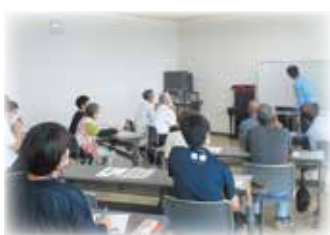
▲研修（安全運転講習）・定期ミーティングも行いながら、安全に活動ができるよう努めています。