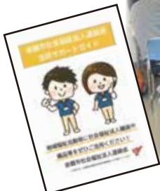
赤磐市社会福祉法人連絡会活用サポートガイド

赤磐市内の社会福祉法人相互の連携・協働により、地域における公益的な取り組みを行っています。