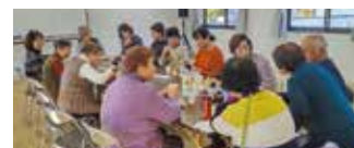
▲体操の後はおしゃべりの時間

西軽部では、会場のリニューアルに合わせて、これまでの世話役に加えて、二人が新たに世話役として協力して下さることになり、三人体制で会場のサポートをしていくことになりました。