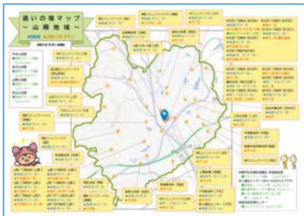
▲サロン・百歳体操など地域別マップ一覧

「通いの場」とは、住み慣れた住民同志が「集い」「しゃべり」「笑い」一緒に時間を過ごし、楽しむ場所です。みなさんの身近な「通いの場」の情報が載っているものが「あかいわ通いの場マップ」です。配布を希望されるかは地域福祉課・各事務所へご相談ください。