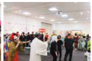
▲フィナーレは参加者全員で阿波踊り