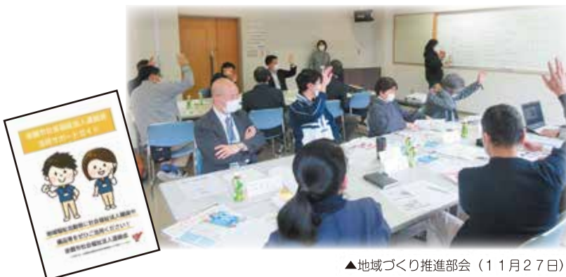
▲地域づくり推進部会（11月27日）