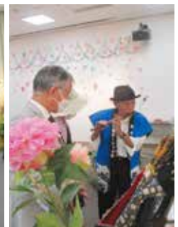
▲展示ブースでは来場者からの質問も