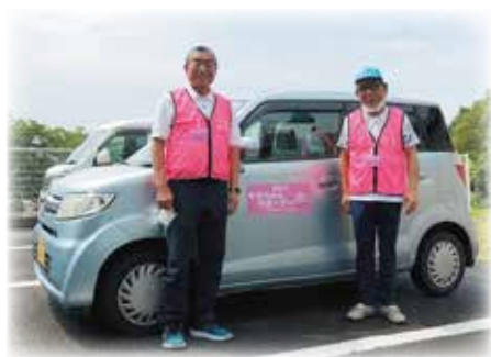
▲素敵な笑顔で伺います！

赤磐市ではご自宅の入浴に不安のある高齢者へ、見守りのもと安心して入浴できるよう「入浴通所サービス」を実施しています。「ももちゃんサポーターの会」のみなさんが、誘い出し・声かけ・歩行の見守り・車への乗降の見守り・施設までの付添を行っています。現在、活動開始から5年が経過し、16名のサポーターが活躍されています。