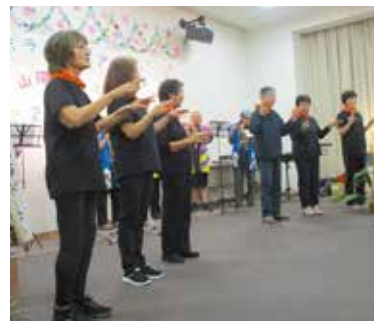
▲手話としの笛の初のコラボステージ

「地区のサロンに来てほしい」などの声も聞かれ、ボランティアと地域とのつながりをより一層深めていけるように、これからも活動支援を継続していきます。