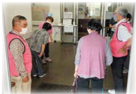
▲入浴施設「ハートフル太陽」へ到着