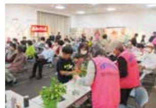
▲野の花をたのしむ体験