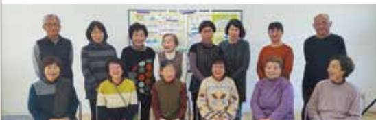
開始：平成29年3月～ 会場：西軽部新公民館 参加者：15名程度