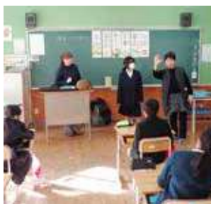
△聴覚障がい者講話・手話体験（12月4日）