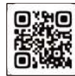
赤磐市社協 ホームページ