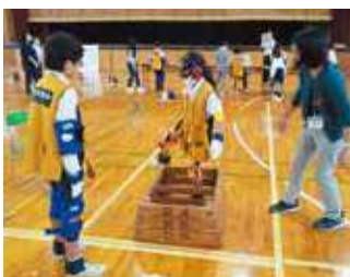
△高齢者疑似体験・車いす体験（10月20日） 聴覚障がい者講話・手話体験（10月23日）