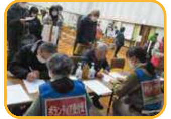
▲災害ボランティアセンター設置運営訓練