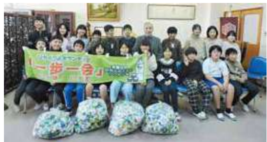
山陽東小学校での贈呈式

あかいわボランティアセンターでご活躍いただいているエコキャップボランティア「一歩一会」さんの集めたペットボトルキャップは、世界の子どもたちへのワクチンに変わっています。身近なスーパーの入口付近や社協の各事務所にキャップ回収ボックスがあり、随時受け付けています。市内の一部の小学校でも集めてくださっています。また、回収後はさくら祭典さくらホールあかいわのご協力により、リサイクル業者へ届けていただいています。