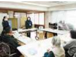
▲利用者・保護者・職員による意見交換会(2月1日) 家庭と作業所での様子を話し合い、交流を深めました。

地域活動支援センター「ももっこ作業所」では、通所により障がいのあるかたが手芸品の作成や園芸、古紙・アルミ缶等回収に取り組んでいます。随時、通所者を募集しております。短時間利用や送迎も可能です。お気軽にご相談ください。