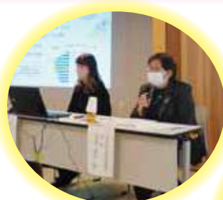
▼活動紹介コーナーを活用した情報交換