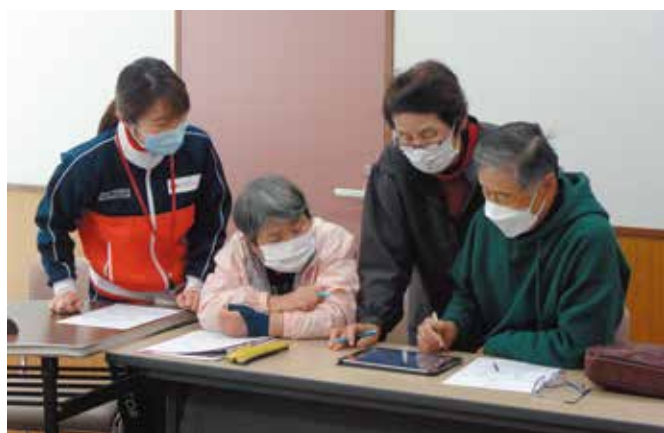
△日本赤十字社岡山県支部を講師に、健やかな高齢期を迎えるための講習を開催しました。 (佐伯北地区社協)