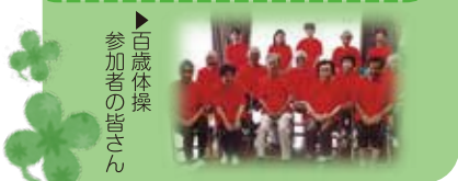
▶百歳体操 参加者の皆さん