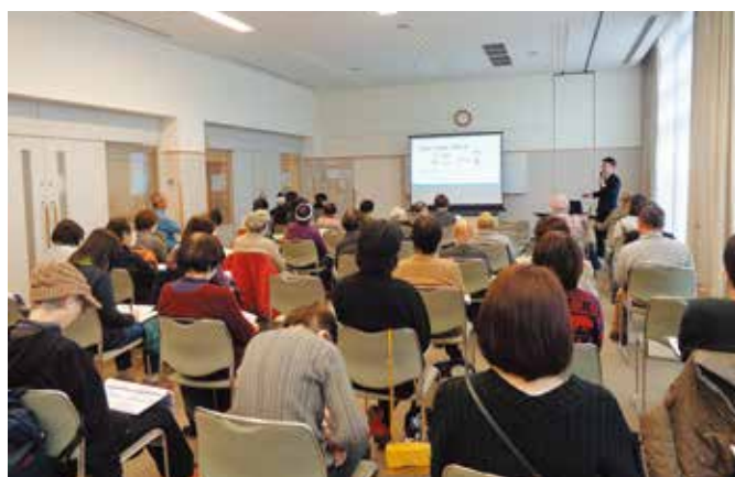
△「認知症対策のすすめ～知っておきたい後見制度・家族信託～」について講演会を開催しました。 (桜が丘東地区社協)