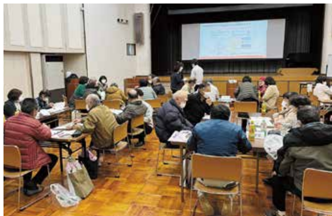
△赤坂地域で4月から本格運行されているデマンド型市民バスについて勉強会を開催しました。 (石相地区社協)