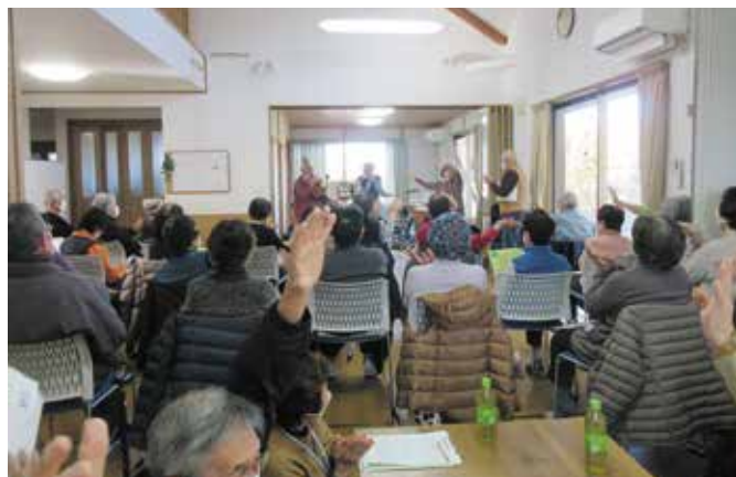
△誰でも参加できる居場所「さんさんカフェ」を開催。認知症についての理解も深めています。 (山陽地区社協)