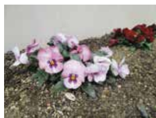
▲花壇のパンジーが手芸作品制作を応援しているようです。

地域活動支援センター「ももっこ作業所」では、通所により障がいのあるかたが手芸や園芸、古紙・アルミ缶等回収に取り組みます。随時、通所者を募集しております。短時間利用や送迎も可能です。お気軽にご相談ください。