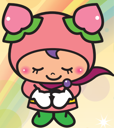
赤磐市社協マスコットキャラクター